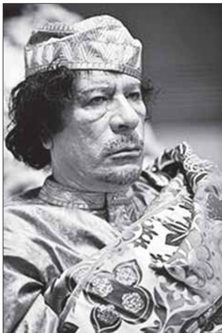
Muammar Al Gaddafi.

Nu er det jo svært at forestille sig, at schweizerne vil tage sig synderligt af hr. Gaddafi og hans nation af gedehyrder og analfabeter. Men blot for den pædagogiske virkning ville det måske være godt, om Schweiz nu da en krigstilstand består mellem det og libyen - benyttede lejligheden til, at internere eller