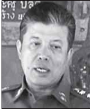
พล.ต.ท. กฤษฏา พันธุ์คงชื่น

หลบการจับกุมของเจ้าหน้าที่ตำรวจก็ตาม @@@ ขอร่วมสาปแช่งไอ้โจร โททรายนี่แค่กับเงินเพียงหมื่นกว่าบาท มันลงทุนใช้ขวดตีนักท่องเที่ยว สาวใหญ่ชาวรัสเซียตาย 1 เจ็บ 1 ที่ชอย ข้างร้านอาหารเจ้าจุกถนน พัทยาเหนือ แต่ต้องการทรัพย์สินข่มขู่เขาก็ คงให้แต่นี้ลงมือถึงตาย สัตว์นรกมาเกิดแท้ ๆ ร.ต.ท.สมชาย ชัยคณากุล รอง.สวป. สก.เมือง พัทยา จ.ชลบุรี ต้องลงมือหาเบาะแส ติดตามไอ้โจร โททรายนี่มาดำเนินคดีให้ได้ @@@ ไม่เช่นนั้นนักท่องเที่ยวขาดความมั่นใจในความปลอดภัยเมื่อไร เมืองพัทยาก็รอบไม่ต้องโทษใคร พังจากน้ำมือไอ้พวกไร้มันสมองพวกนี้เอง เคยพูดหลายหนว่าผู้ที่หา กินกันในเมืองพัทยานี้แหละที่"ขยันไล่ตักท่องเที่ยว"กันจริง ๆ @@@ เห็นท่าน พล.ต.ต.อดิศักดิ์ จามจิตสุขศรี ผบ.ท.ท.เดินทางมาเป็นประธานปล่อยแถวระดมกวาดล้างปราบปรามอาชญากรรมช่วงก่อนปีใหม่ โดยมี พล.ต.ท.สุวรรณ อุ่นอนันต์ สารวัตรสถานีตำรวจท่องเที่ยวเมืองพัทยา พร้อมทั้งตำรวจสายตรวจจักรยานและจักรยานยนต์และเรือเร็วช่วยเหลือผู้ประสบเหตุ