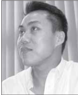
พล.ต.ท. สุวรรณ อุ่นอนันต์

ทางทะเลของตำรวจท่องเที่ยว กำลังอาสาสมัครช่วยนักท่องเที่ยวทั้งไทยและต่างชาติได้ยื่นท่านเน้นการทำงานเพื่อชื่อเสียงของประเทศไทย ต่อสายตาของนักท่องเที่ยวทั่วโลก @@@ แฮม...!!! ท่านเน้นมาไม่กี่วันเอง อาสาสมัครชาวต่างชาติดันมาก่อเหตุเมาซึ่งปีค้อพระบาทหลวง เสียชีวิตสัญญาเสี่ยงไซเรนส่งเสียงดังป่วนเมือง ทั้งเปิดสัญญาไฟไซเรนที่ติดเอาไว้ที่หน้ารถตลอดเส้นทาง สร้างความเดือดร้อนรำคาญให้กับชาวบ้านและนักท่องเที่ยว เอ้อ...อาสามาช่วยเหลือส่วนรวมแต่กลับมาสร้างความเดือดร้อนรำคาญให้ส่วนรวมเสียเอง เอ้าต้นสังกัดดูแลด้วย @@@ ใกล้ปีใหม่เข้าไปทุกวัน คดีสำคัญ ๆ ก็เกิดขึ้นมาตลอด โดยเฉพาะช่วงนี้จะได้เวลากวาดล้างอาวุธปืนได้แล้ว เพราะอาทิตย์ที่