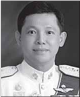
พล.ต.ท. พงศพัศ พงษ์เจริญ