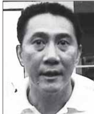
พล.ต.ต.อดิศักดิ์ จามจิตสุขศรี

หลบการจับกุมของเจ้าหน้าที่ตำรวจก็ตาม @@@ ขอร่วมสาปแช่งไอ้โจร โททรายนี่แค่กับเงินเพียงหมื่นกว่าบาท มันลงทุนใช้ขวดตีนักท่องเที่ยว สาวใหญ่ชาวรัสเซียตาย 1 เจ็บ 1 ที่ชอย ข้างร้านอาหารเจ้าจุกถนน พัทยาเหนือ แต่ต้องการทรัพย์สินข่มขู่เขาก็ คงให้แต่นี้ลงมือถึงตาย สัตว์นรกมาเกิดแท้ ๆ ร.ต.ท.สมชาย ชัยคณากุล รอง.สวป. สก.เมือง พัทยา จ.ชลบุรี ต้องลงมือหาเบาะแส ติดตามไอ้โจร โททรายนี่มาดำเนินคดีให้ได้ @@@ ไม่เช่นนั้นนักท่องเที่ยวขาดความมั่นใจในความปลอดภัยเมื่อไร เมืองพัทยาก็รอบไม่ต้องโทษใคร พังจากน้ำมือไอ้พวกไร้มันสมองพวกนี้เอง เคยพูดหลายหนว่าผู้ที่หา กินกันในเมืองพัทยานี้แหละที่"ขยันไล่ตักท่องเที่ยว"กันจริง ๆ @@@ เห็นท่าน พล.ต.ต.อดิศักดิ์ จามจิตสุขศรี ผบ.ท.ท.เดินทางมาเป็นประธานปล่อยแถวระดมกวาดล้างปราบปรามอาชญากรรมช่วงก่อนปีใหม่ โดยมี พล.ต.ท.สุวรรณ อุ่นอนันต์ สารวัตรสถานีตำรวจท่องเที่ยวเมืองพัทยา พร้อมทั้งตำรวจสายตรวจจักรยานและจักรยานยนต์และเรือเร็วช่วยเหลือผู้ประสบเหตุ