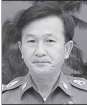
พล.ต.ต.ธเนศร์ พิณเมืองงาม

หมื่นขอให้มารับได้ตามจุดนัดหมาย คนร้ายก็หลงกลเพราะชอบของฟรี มาติดกับ จับเข้าคุกไปสิบกว่าราย สุดยอดฝีมือจริง ๆ @@@ ตำรวจ อาชีพนี้คงต้องยกให้ ร.ต.อ.สมภพ คูหาวรรณ รองสว.สส. สก. เมืองพัทยา เพราะขนาดไปทานขนมหวานข้างทาง ท่านยังถามชอก แหกหาข่าวตลอดตามอะไรชาวบ้านบอกหมดไม่มีปิดบังเพราะเข้าใจว่า ท่านเป็นอาสาเดินทางมาเที่ยวพัทยา ท่านจึงหาข่าวได้ลึกกว่าที่สายข่าว รายงาน @@@ นักท่องเที่ยวและประชาชนอุ่นใจได้เลย เพราะได้รับการยืนยันจากท่าน พล.ต.ต.ธเนศร์ พิณเมืองงาม ผบก.ภ.จว. ชลบุรี และท่าน อิทธิพล คุณปลื้ม นายกเมืองพัทยา ว่าจังหวัด ชลบุรีและเมืองพัทยาได้เตรียมความพร้อมในการรับมือกับปัญหา ความปลอดภัยในชีวิต และทรัพย์สินของประชาชนและนักท่องเที่ยว ที่จะเดินทางมาสังสรรค์วันปีใหม่ในเมืองพัทยา ไม่ว่าจะปัญหาเล็ก ๆ อย่าง ดิซิงก์ไวรัสไปจนถึงการก่อการร้ายสร้างความวุ่นวายต่าง ๆ ทั้งสองท่าน บอกพร้อมมาก ๆ @@@ แต่ช่วงนี้เป็นช่วงที่ทุก ๆ คนก็อยากจัดปาร์ตี้