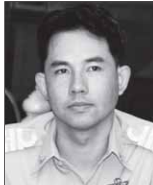
อิทธิพล คุณปลื้ม

หมื่นขอให้มารับได้ตามจุดนัดหมาย คนร้ายก็หลงกลเพราะชอบของฟรี มาติดกับ จับเข้าคุกไปสิบกว่าราย สุดยอดฝีมือจริง ๆ @@@ ตำรวจ อาชีพนี้คงต้องยกให้ ร.ต.อ.สมภพ คูหาวรรณ รองสว.สส. สก. เมืองพัทยา เพราะขนาดไปทานขนมหวานข้างทาง ท่านยังถามชอก แหกหาข่าวตลอดตามอะไรชาวบ้านบอกหมดไม่มีปิดบังเพราะเข้าใจว่า ท่านเป็นอาสาเดินทางมาเที่ยวพัทยา ท่านจึงหาข่าวได้ลึกกว่าที่สายข่าว รายงาน @@@ นักท่องเที่ยวและประชาชนอุ่นใจได้เลย เพราะได้รับการยืนยันจากท่าน พล.ต.ต.ธเนศร์ พิณเมืองงาม ผบก.ภ.จว. ชลบุรี และท่าน อิทธิพล คุณปลื้ม นายกเมืองพัทยา ว่าจังหวัด ชลบุรีและเมืองพัทยาได้เตรียมความพร้อมในการรับมือกับปัญหา ความปลอดภัยในชีวิต และทรัพย์สินของประชาชนและนักท่องเที่ยว ที่จะเดินทางมาสังสรรค์วันปีใหม่ในเมืองพัทยา ไม่ว่าจะปัญหาเล็ก ๆ อย่าง ดิซิงก์ไวรัสไปจนถึงการก่อการร้ายสร้างความวุ่นวายต่าง ๆ ทั้งสองท่าน บอกพร้อมมาก ๆ @@@ แต่ช่วงนี้เป็นช่วงที่ทุก ๆ คนก็อยากจัดปาร์ตี้