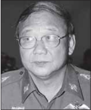
พล.ต.อ.ประทีป ดันประเสริฐ