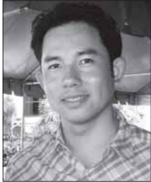
อิทธิพล คุณปลื้ม

ได้อีกหลายคดี @@ งานนี้ไม่พ่นมือ พ.ต.ต.ภาคสุวัฒน์ ชมถนอม สว.สส.สภ.หัวใหญ่ เพราะหลายคดีที่ใหญ่กว่านี้ท่านก็ปิดน็อกมาแล้ว @@ และเช่นเดียวกันเห็นน้อง ๆ นักข่าวสอบถามว่ามีผู้มอบลูกสุนัขสายพันธุ์ลา บราดอ ให้และรับปากว่าจะทำการฝึกสุนัขทั้ง 2 ตัว ให้ปฏิบัติหน้าที่ในการดมกลิ่นหาสารเสพติดให้จนสำเร็จขั้นสูงสุดที่ท่าน พ.ต.ต.ภาคสุวัฒน์ ชมถนอม สว.สส.ให้คำมั่นสัญญาว่า ผลงานการจับกุมยาเสพติดจะต้องมีเพิ่มมากขึ้นและสถิติของผู้ค้าและเสพจะต้องลดลงอย่างแน่นอน ตอนนี้อยู่ถึงขั้นไหนแล้วครับนักข่าวบอกอยากทำข่าวดี ๆ อย่างนี้เผยแพร่ให้สังคมได้รับรู้บ้าง @@ ทราบข่าวว่าตำรวจนำดีมีฝีมืออย่างท่าน ร.ต.อ.ศราวุฒิ บุญชัย รอง สวป. สภ.เมืองพัทยา กำลังดวงขึ้นแล้ว ๆ ว่าตำแหน่งสารวัตรอยู่แค่เอื้อม แต่หน้าเสียดยครับเสียดยที่จะต้องเดินทางไปรับตำแหน่งที่อื่น อยากรู้คดีด้วยครับ และน้อง ๆ "นักข่าวสายค้างคาว" ฟลากขอบคุณ ร.ต.อ.ศราวุฒิ บุญชัย มาในโอกาสนี้ด้วย ที่ท่านเดินทางไปร่วมงาน